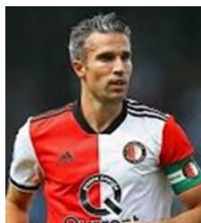
ロビン・ファン・ペルシ氏が息子にかけた言葉

一方、学校は、夏休みの期間中に様々な工事が入りました。例えば、1・3年生の教室に大型液晶モニターの設置、給食配膳室の棚の付け替え、格技場の床板の修繕・張替、多目的ホール窓開閉装置修繕、グラウンドへの土搬入等、コロナ対策を含めた衛生面、事故や怪我の防止面、行事への充実に向け準備をしてきました。